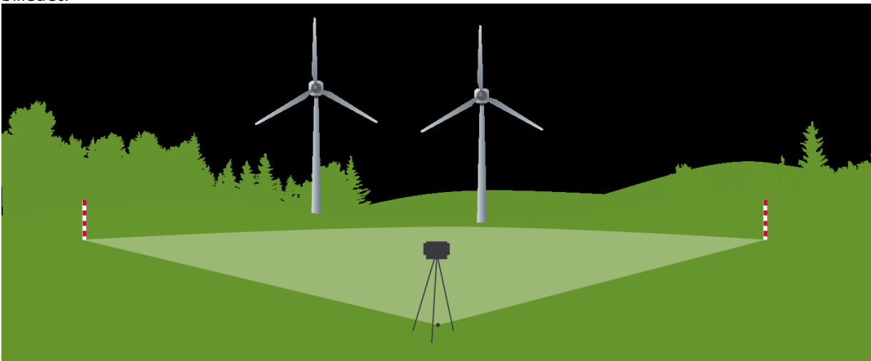
Figur 2 Fotopunkt.

Kontrolpunkterne benyttes til at kalibrere fotoretningen og brændvidden samt til placering af vindmøller i billedet.